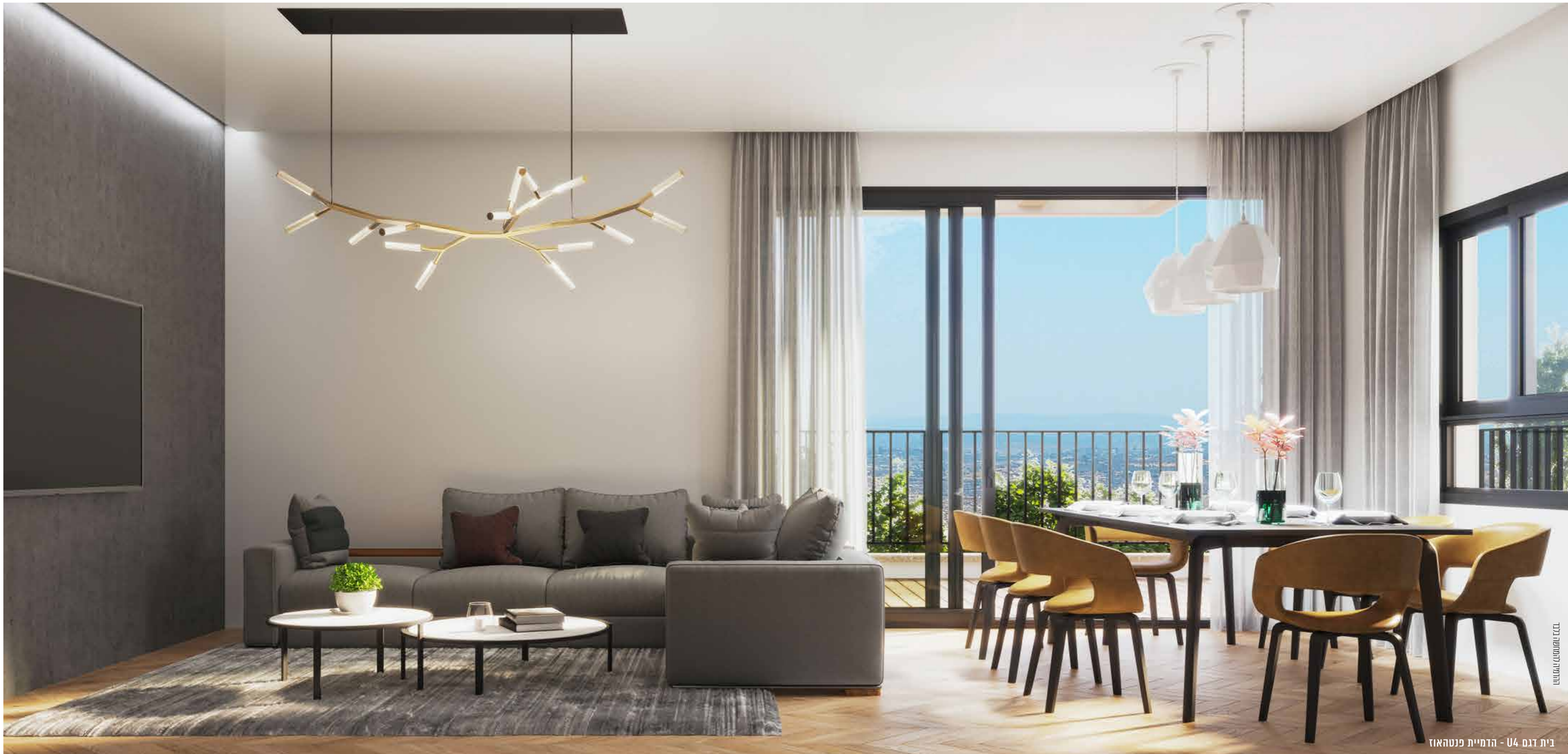
בית דגם U4 - הדמיית פנטהאוז