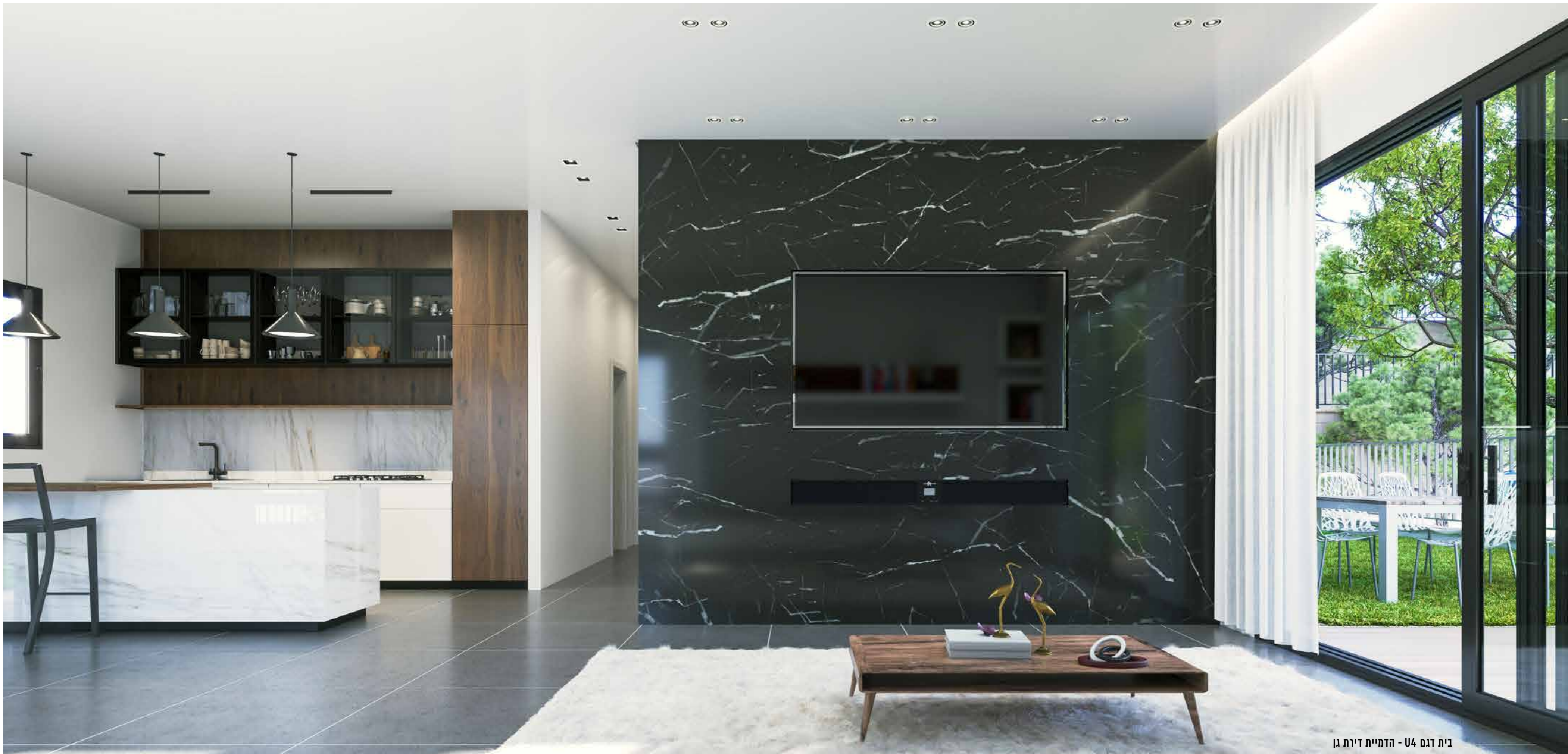
בית דגם U4 - הדמיית דירת גן