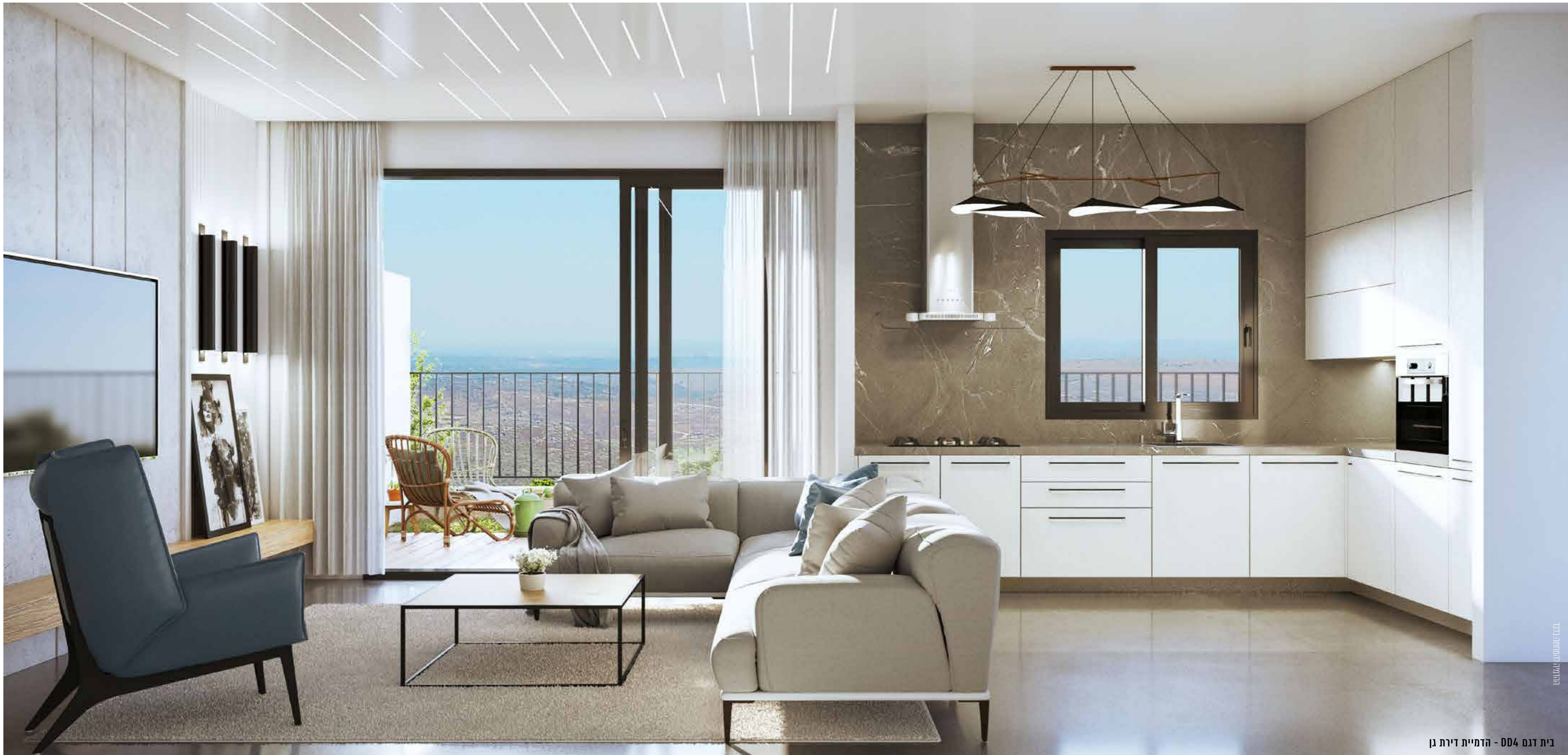
בית דגם DD4 - הדמיית דירת גן