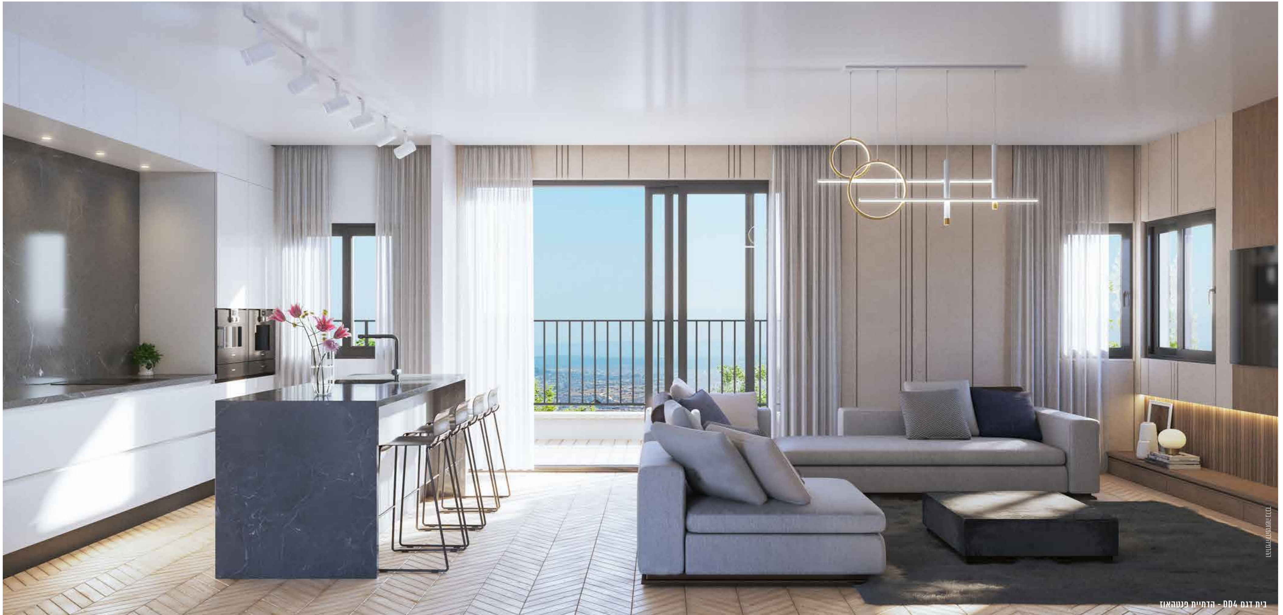
בית דגם DD4 - הדמיית פנטהאוז