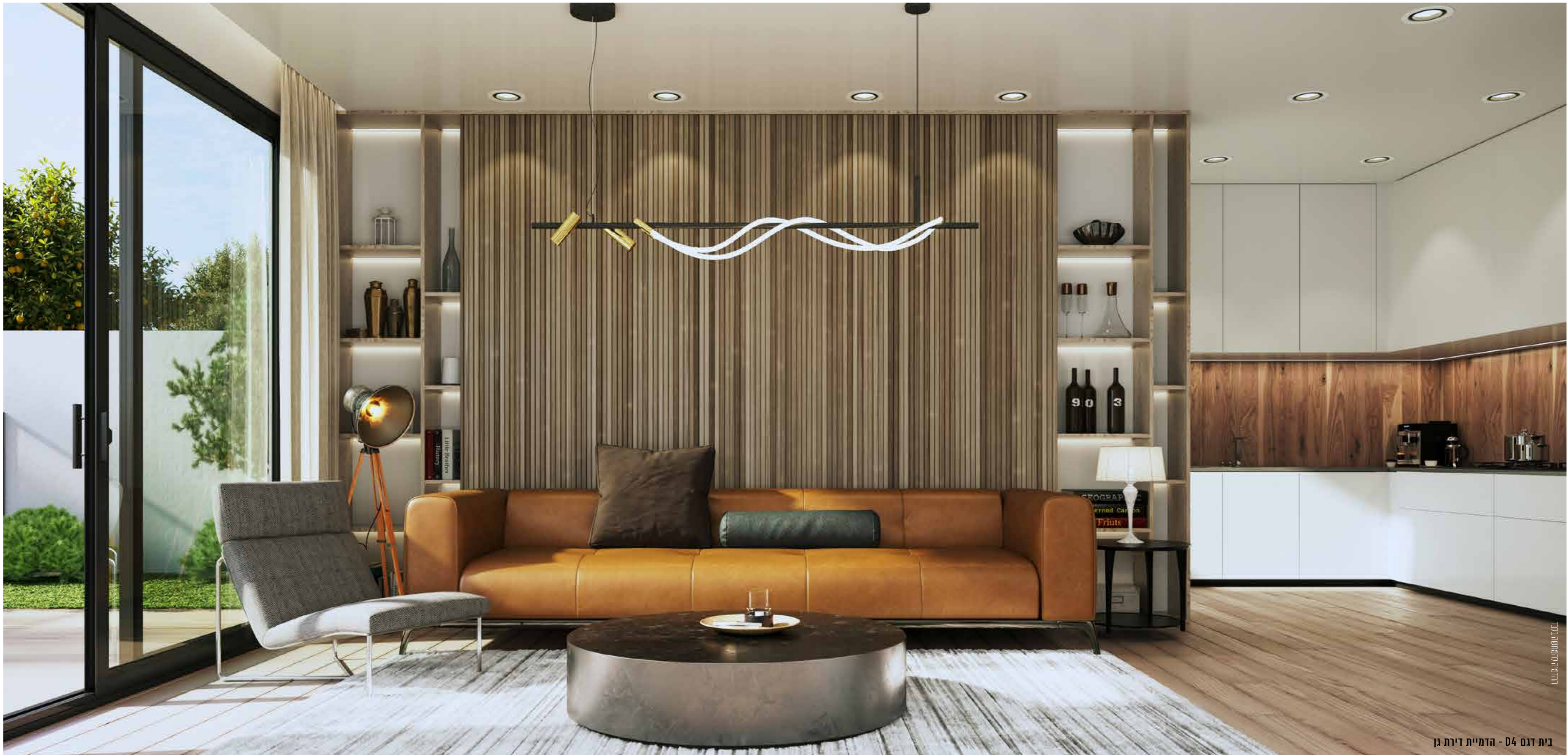
בית דגם D4 - הדמיית דירת בן