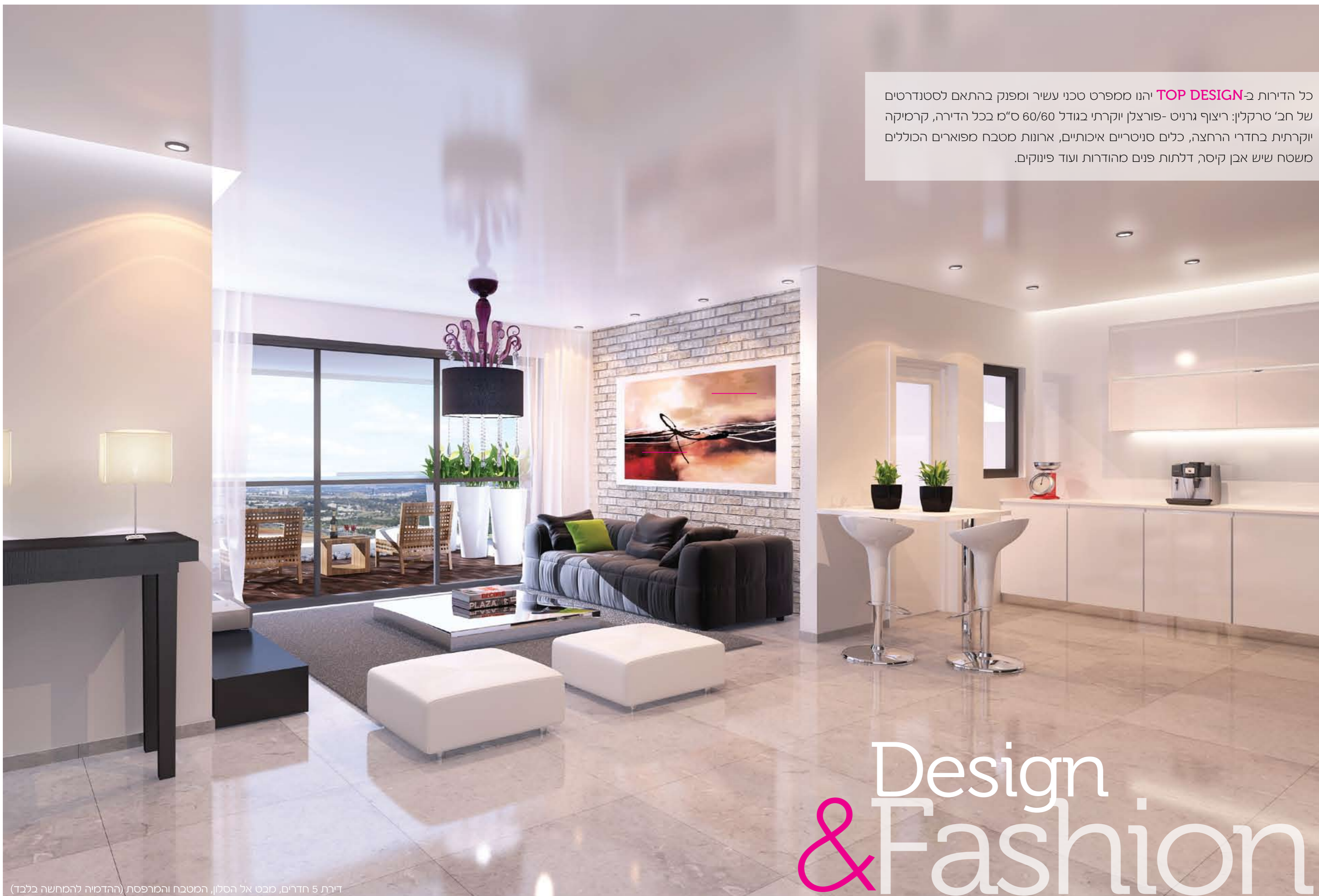
דירת 5 חדרים, מבט אל הסלון, המטבח והמרפסת (ההדמיה להמחשה בלבד)

כל הדירות ב- TOP DESIGN יהנו ממפרט סכני עשיר ומפנק בהתאם לסטנדרטים של חב' טרקלין: ריצוף גרניט-פורצלן יוקרתי בגודל 60/60 ס"מ בכל הדירה, קרמיקה יוקרתית בחדרי הרחצה, כלים סניטריים איכותיים, ארונות מטבח מפוארים הכוללים משטח שיש אבן קיסר, דלתות פנים מהודרות ועוד פינוקים.