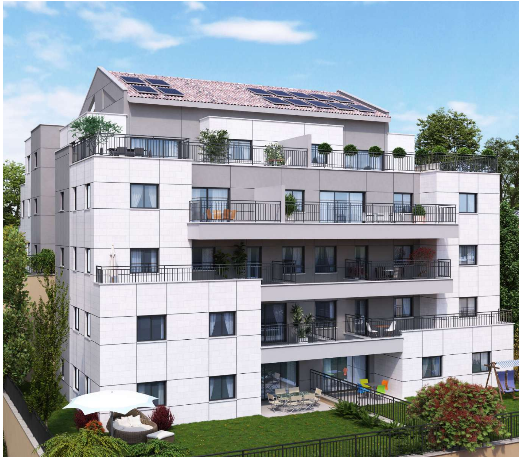
הדמיה להמחשה בלבד