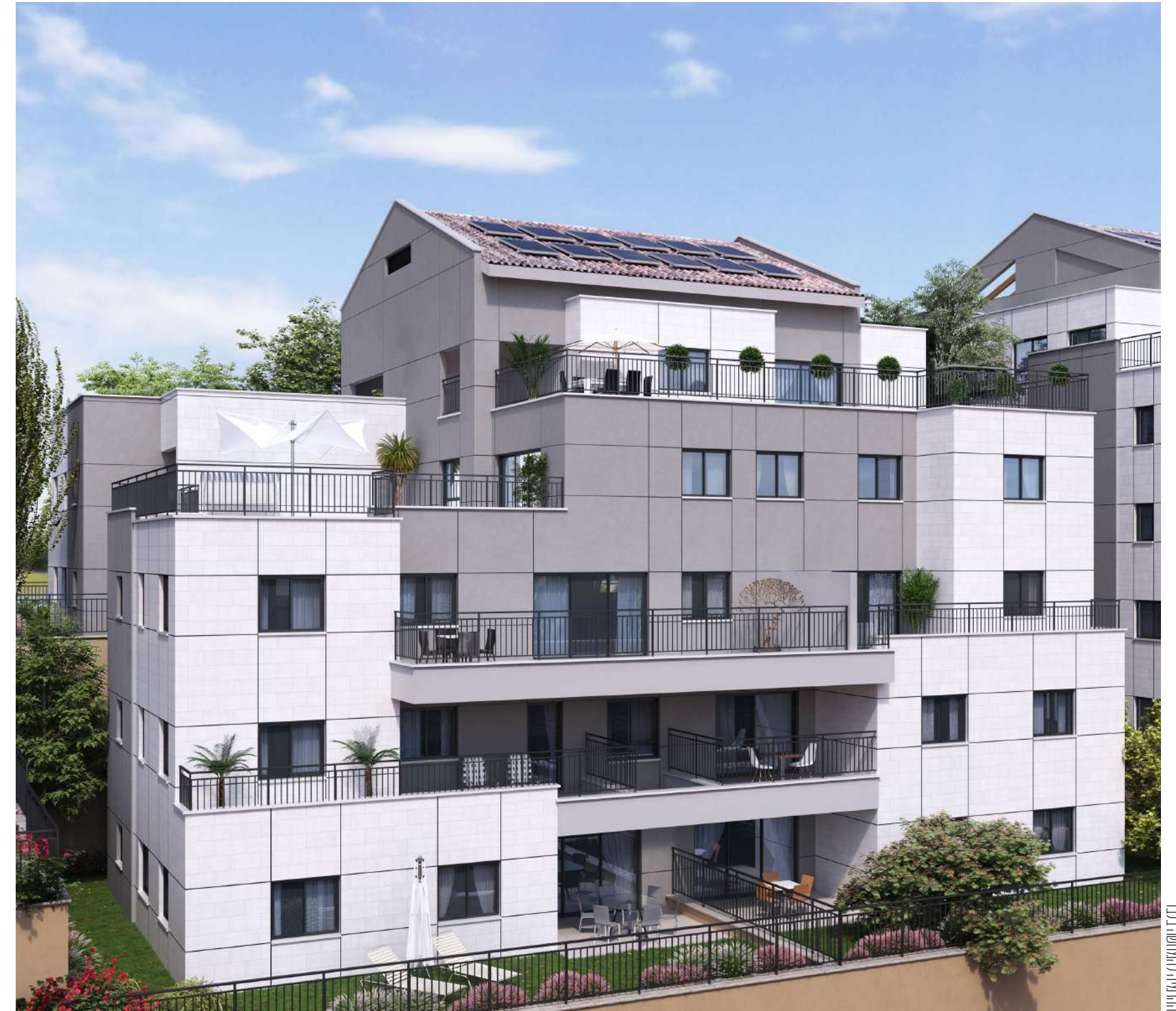
בית מטיפוס A1 (הדמיה מכיוון הנוף)