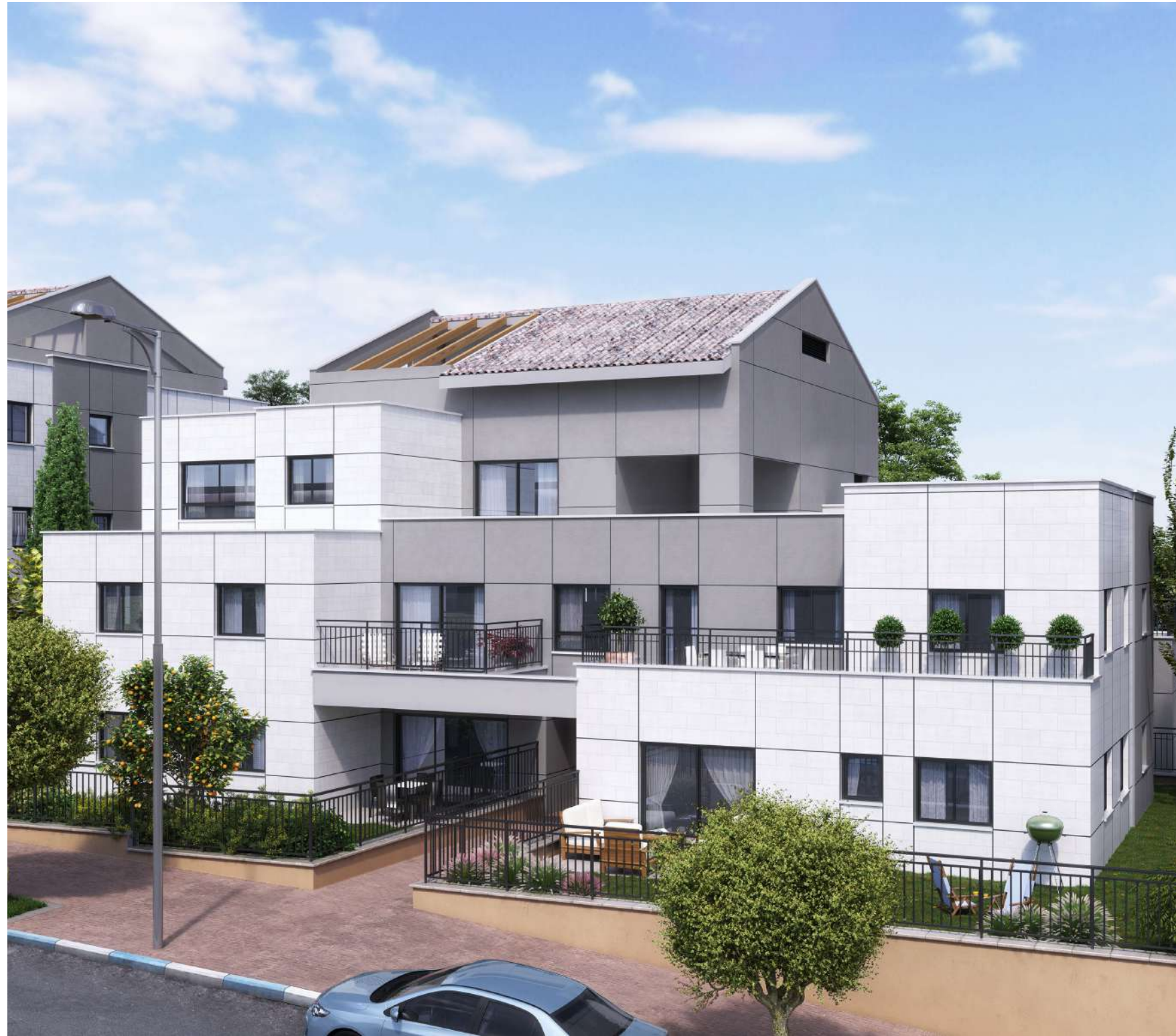
בית מטיפוס A1 (הדמיה מכיוון הרחוב)